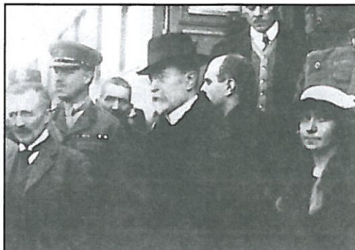
Příjezd prezidenta Masaryka do Prahy v roce 1918

Československou republiku tvořily čtyři země: Čechy, Morava s částí Slezska, Slovensko a Podkarpatská Rus .