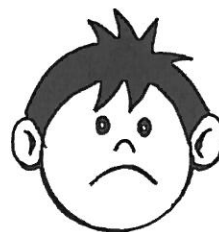
nejde mi to